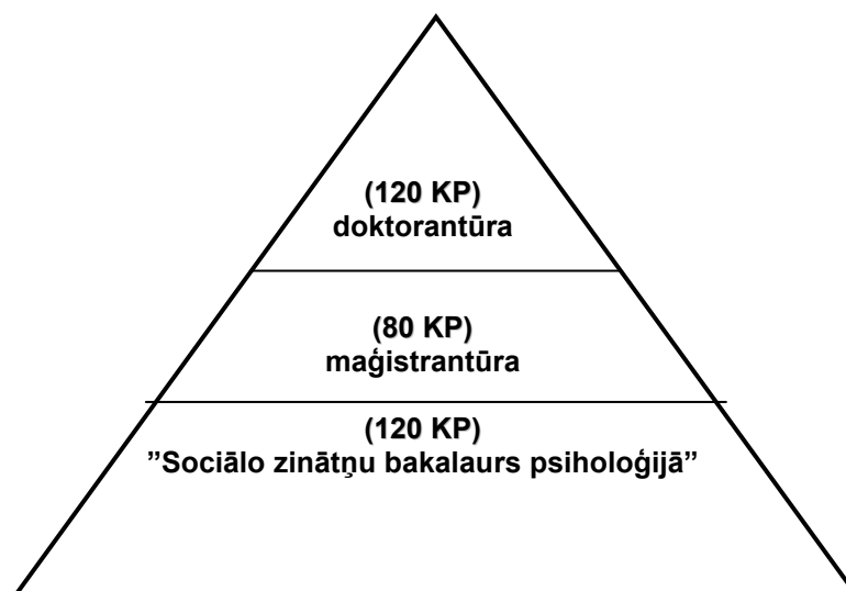
1. att. Psiholoģijas studiju programmu realizācijas shēma DU Sociālās psiholoģijas katedrā

Psiholoģijas bakalaura (studiju programmas kods 43310) maģistra (studiju programmas kods 45310) un doktora (studiju programmas kods 51310) akadēmisko studiju programmas ir izstrādātas un tiek realizētas Daugavpils Universitātes Sociālo zinātņu fakultātes Sociālās psiholoģijas katedrā, lai piedāvātu pilnu akadēmiskās izglītības ciklu psiholoģijā - bakalaura, maģistra un doktora studiju līmeņos.