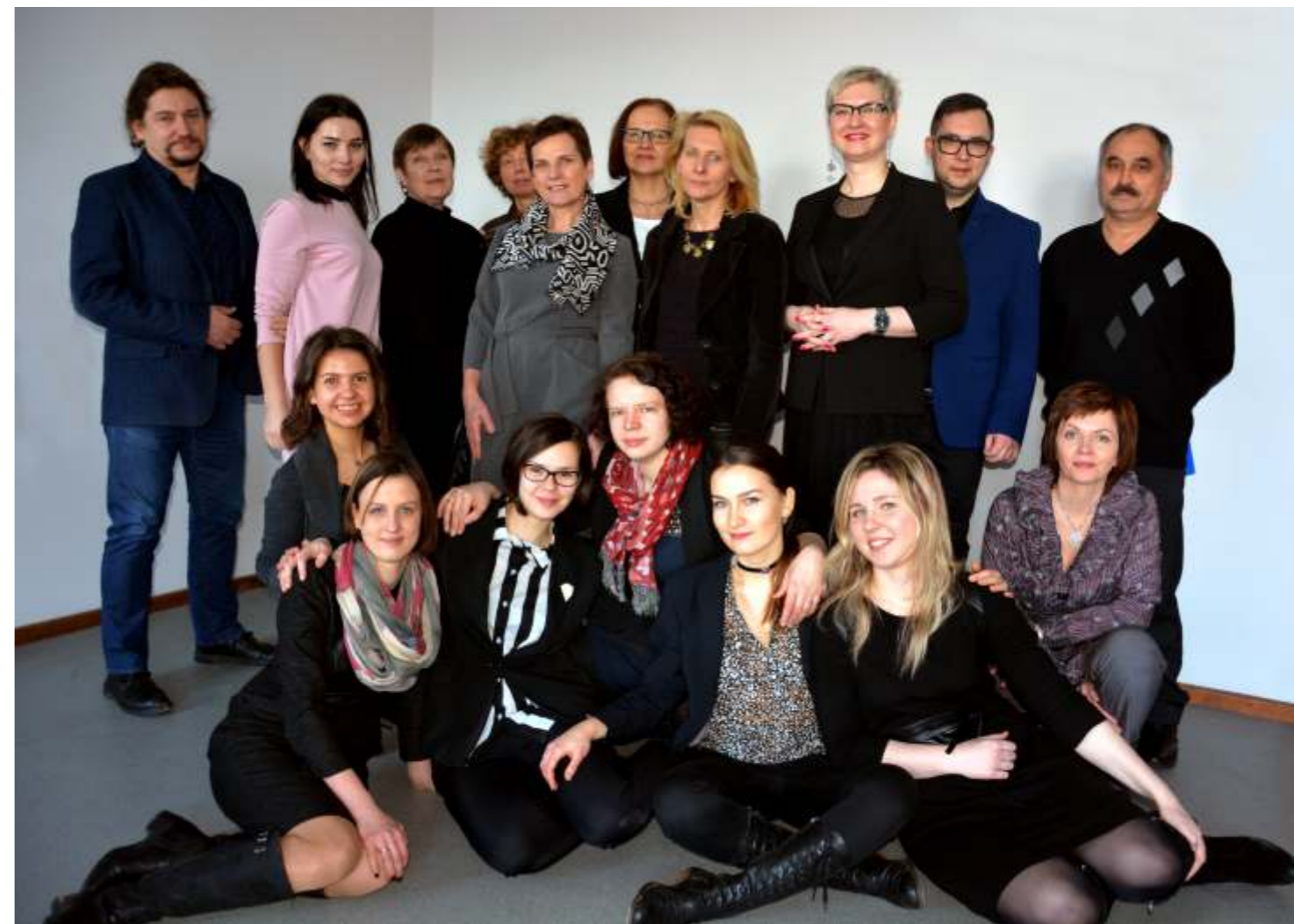
© Dizains - Māris Strautmalis © Mākslas zinātņu institūts, Daugavpils Universitāte

KOPBILDE PĒC DARBU AIZSTĀVĒŠANAS 2016/2017